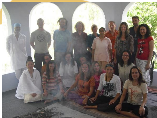
Phool Chatti Ashram 2010

Alle maaltijden, verblijf en activiteiten zijn inbegrepen.