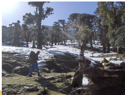
Chopta trekking 2007